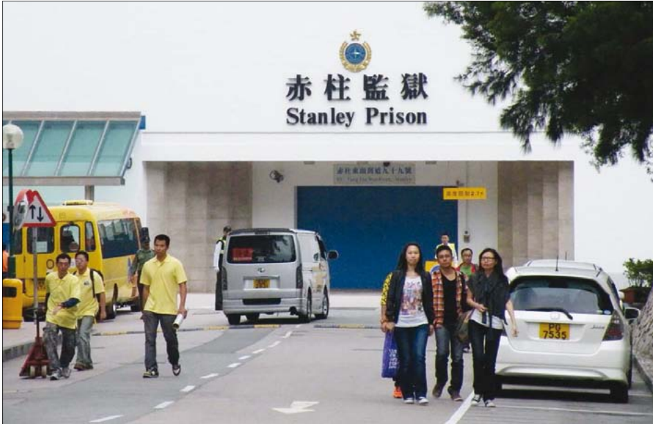
Stanley est l'un des six établissements à sécurité maximale de Hong Kong