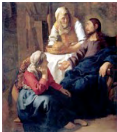
Le Christ chez Marthe et Marie (J. Vermeer)

l'origine des problèmes et nous ne pourrions que réagir aux symptômes. L'unité très évoluée de la conscience contemplative peut paraître inatteignable, parfois. Du point de vue de la raison, elle est difficile à imaginer. Du point de vue du ressenti, elle ressemble à un rêve. Mais lorsque l'on voit sa simplicité essentielle (et les enfants nous en apprennent beaucoup en la matière !), elle semble venir à notre portée. Seule une pratique simple, suivie avec foi, la réalise d'une manière que l'œil n'a pas vue, l'oreille n'a pas entendue et le cœur de l'homme n'a pas imaginée. Il est impossible de l'analyser tant qu'elle n'est pas survenue, comme Jésus le déclare à propos du Royaume lui-même. En effet, cette conscience contemplative qui à la fois nous prépare à la crise et nous aide à la traverser est le résultat direct de l'expérience du Royaume.