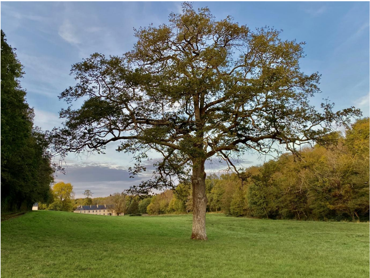
Arbre de Pâques, Bonnevaux

Le dimanche de Pâques est le jour le plus long de l'année. Depuis sa création, il est devenu chaque jour.