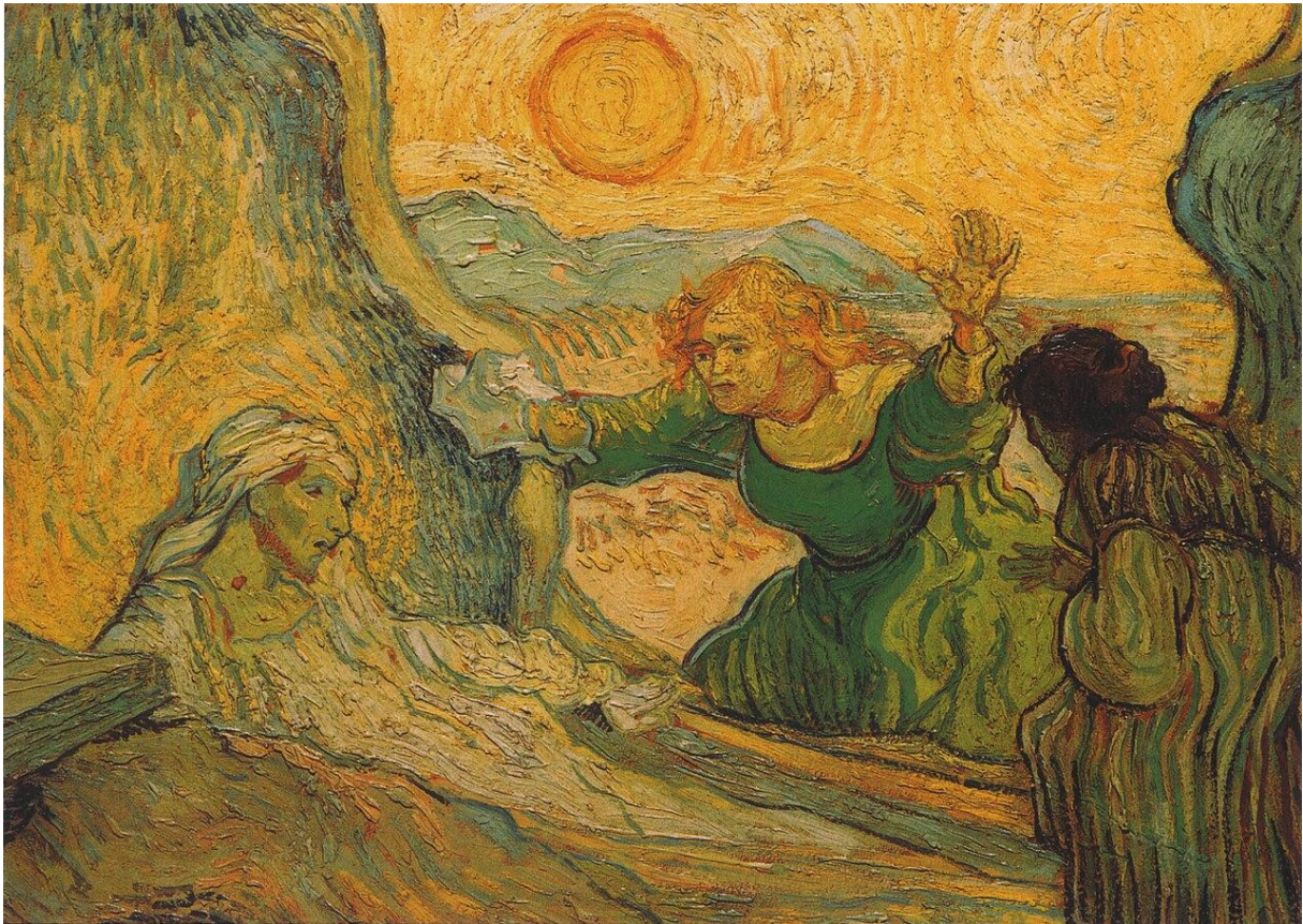
Vincent Van Gogh – La Résurrection de Lazare (d'après Rembrandt)

Au moment où j'écris ces lignes, des feux d'artifice illuminent le ciel de Penang pour la fin du Ramadan. Bientôt, nous chanterons et décorerons les lieux de culte pour la fin des trois jours que Jésus a passés aux enfers, dans cet espace liminal entre la vie terrestre et la Vie éternelle. La résurrection de Lazare nous prépare aux mystères de Pâques. C'est un récit d'une simplicité complexe, dont les multiples niveaux de sens et les paradoxes forment une sorte de labyrinthe dans lequel il nous faut pénétrer avant d'en saisir le sens.