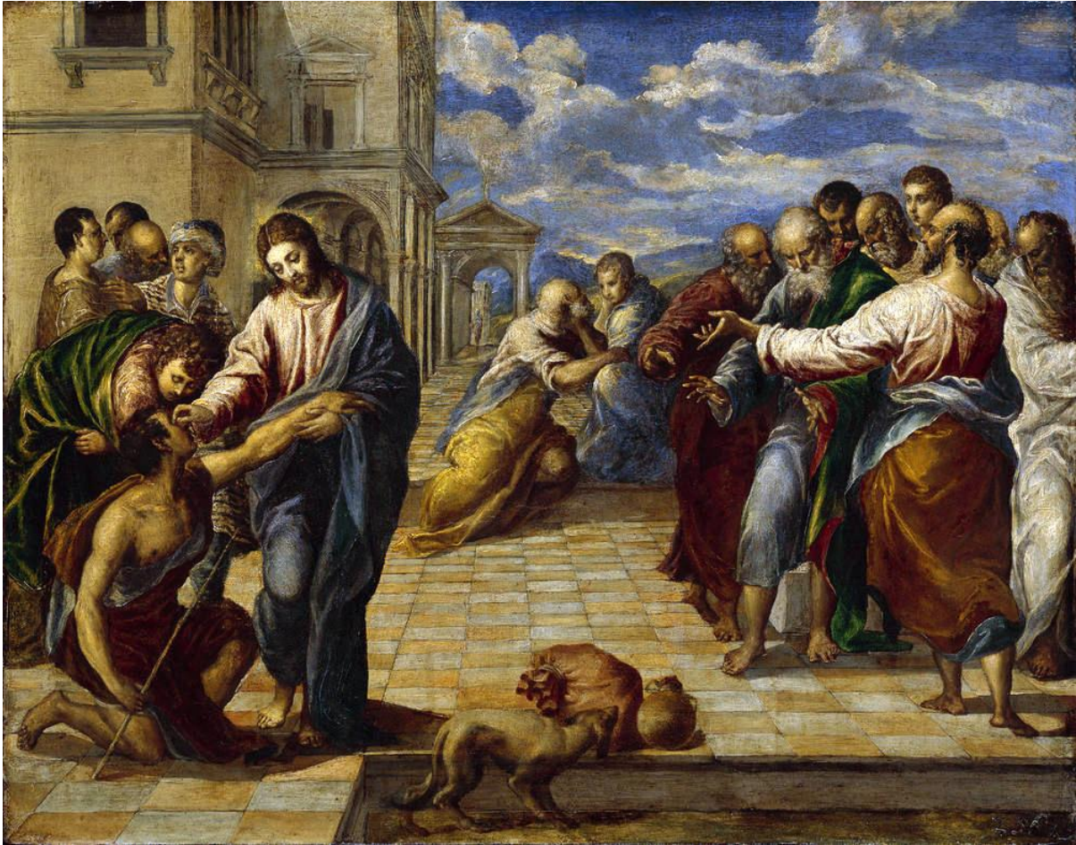
La Guérison de l'aveugle par El Greco à Dresde

Peu après mon entrée au monastère, je remarquai une légère distorsion de la vision à un œil, une zone floue que je ne pouvais pas faire disparaître en clignant des yeux. Mon opticien me conseilla de consulter un spécialiste et un rendez-vous fut fixé six semaines plus tard. Lorsque le père Jean apprit cela, il appela un homme de la paroisse du monastère qui, il s'avéra, était le meilleur chirurgien ophtalmologue du pays. Il pensa qu'il ne s'agissait probablement de rien, mais accepta de m'examiner pendant sa pause déjeuner le lendemain. Il détecta un décollement de la rétine imminent aux deux yeux et pratiqua avec succès une opération au laser le même après-midi. Depuis lors, l'Évangile du jour me rappelle ma peur de la cécité et le soulagement joyeux d'avoir recouvré la vue. La semaine dernière, dans l'histoire de la femme au puits, il nous fallait saisir la double signification du