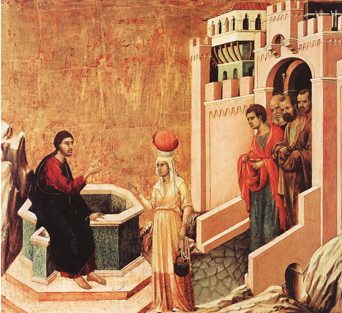
Duccio di Buoninsegna - Christ et la Samaritaine

Cette histoire est l'une des plus chargées de sens de tout l'évangile. Cela demande du temps et de l'attention, mais il récompense grandement notre investissement.